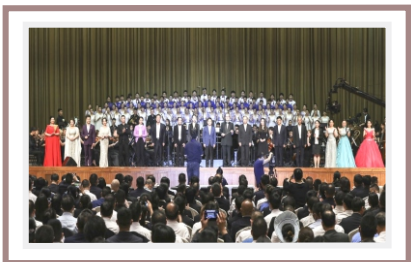
音乐专业学生参加大型演出