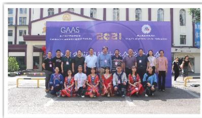
贵州省应用统计学会2021年学术年会