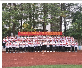
学党史、诵经典、筑师魂