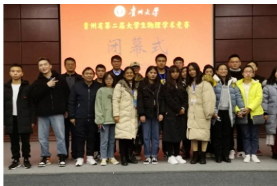
学生在贵州省第二届大学生物理学术竞赛中取得优异成绩