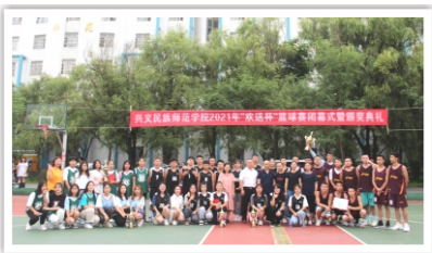
数学学院2021年欢送杯球赛第一名