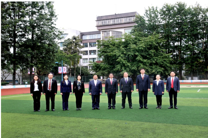
团结奋进的校党委班子

两百多年来，学校持续办学、未断文绪，而今，更是秉承“勤学、尚美、求实、创新”的校训，将人才培养与地方经济社会发展紧密结合，不断提高办学水平和办学层次，为国家培养各级各类人才近3万人，为黔西南州的经济社会发展作出了积极贡献，取得了良好的社会声誉。