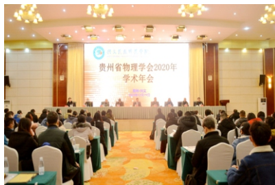
贵州省物理学会2020年学术年会

就业方向：应用电子技术教育专业的毕业生，可在职业技术学院、中等教育学校等教育部门从事应用电子技术、电子信息工程方面的学科教学、科研、信息处理和管理工作。还可在电子产品设计与制造领域，到电子、电气公司或相关企业从事科学研究、科技开发以及集成、制造与推广等方面的工作。