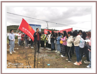
人文地理与城乡规划专业户外实践活动