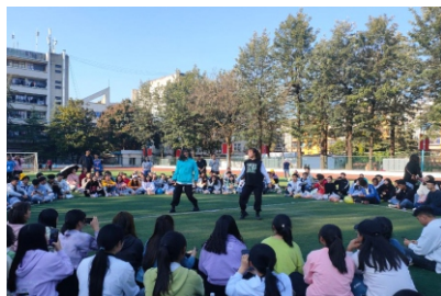
2020级新生联谊交流会