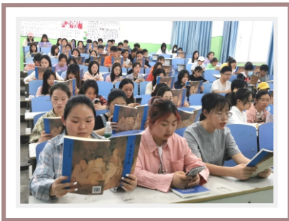
学院“儒商堂”晨读经典