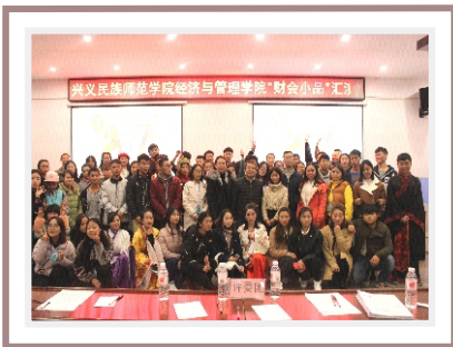
财务管理专业实践活动

就业方向：旅行社，旅游景区（景点），酒店，旅游度假村等等；政府、事业单位（旅游行政管理部门）；旅游咨询公司；旅游电子商务企业；旅游营销策划企业；旅游与休闲行业的自主创业；参与开发乡村旅游与休闲产业；科研、教学机构。