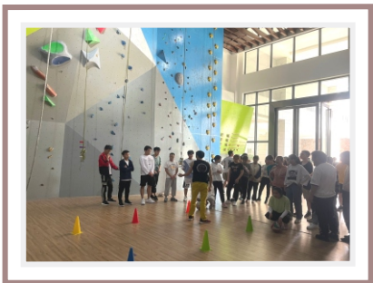
旅游管理与服务教育专业实践教学