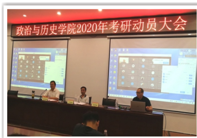
学院召开考研动员会