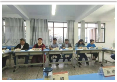
学院召开民主生活会