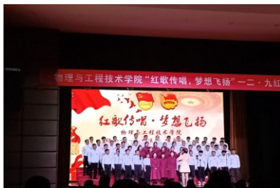
红歌传唱，梦想飞扬——一二·九红歌比赛