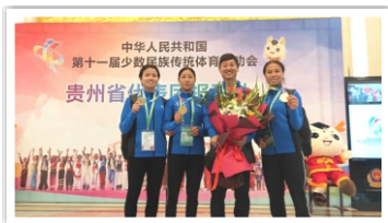
参加第十一届全国少数民族传统体育运动会