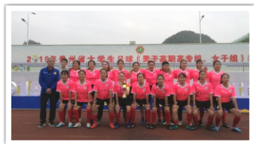
2019年参加贵州省足球比赛