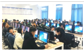
基础云桌面实验室