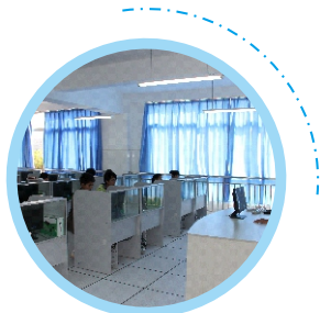
认知与测量实验室