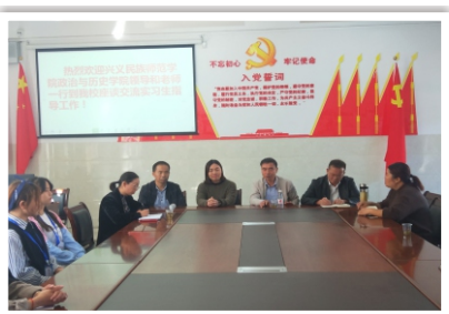
学院在桔山中学进行实习检查