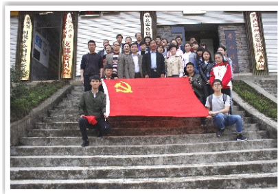
党员、教师到泷洞村学习“新时代贵州精神”